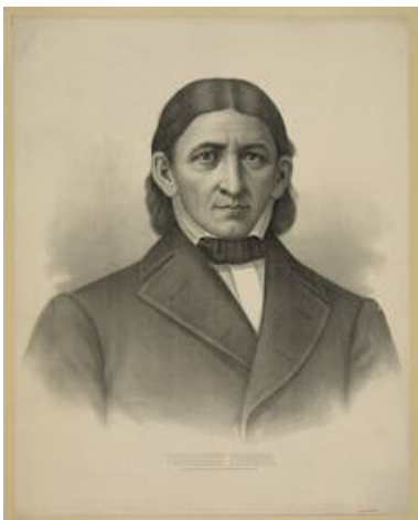
Portrait de Froebel.

Ce qui caractérise les jardins d'enfants, c'est d'une part la pédagogie qui accorde une place centrale au jeu, considéré comme vecteur d'apprentissage, et d'autre part l'environnement, proche du modèle familial, et au plus près de la nature, pour permettre le plein épanouissement de l'enfant. En ce début du XX e siècle qualifié de « siècle de l'enfant » par l'écrivain suédoise Ellen Key, médecins, pédagogues, scientifiques se saisissent de l'éducation pour révolutionner les pratiques éducatives et penser le bonheur de l'enfant à l'école.